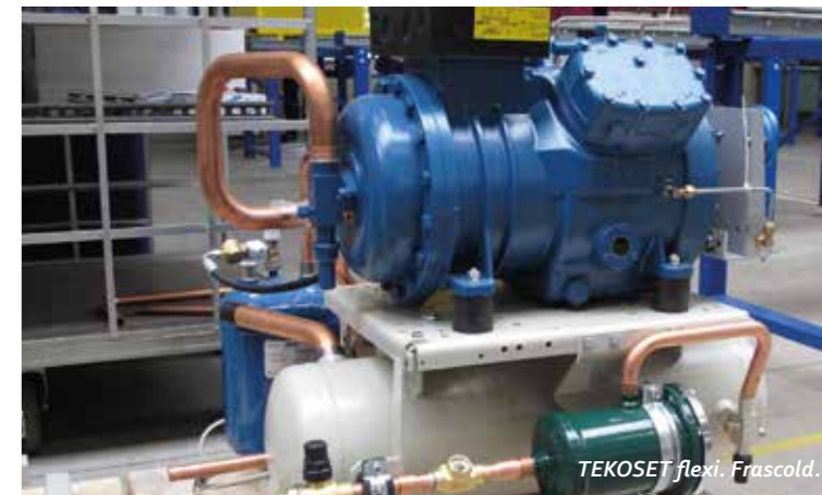
TEKOSSET flexi. Frascold.

Metzgereien, Bäckereien, Raststätten, Krankenhäuser, Lebensmittelgeschäfte, Eisdiele, Gaststätten, Hotels, Stadthallen und viele mehr.