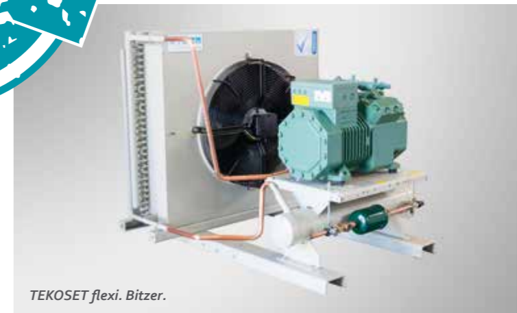
TEKOSSET flexi. Bitzer.

Das TEKOSSET flexi bietet eine hohe Auswahl an Optionen. Optimal zu kombinieren für Ihren Bedarf. Wählen Sie vom Rumpffaggregat bis zum luft- oder wassergekühlten Verflüssigungssatz das für Ihre Anwendung passende Gerät – mit Frascold-, Bitzer- oder L'Unité-Verdichter. Multiple Aufstellungsvarianten durch leicht trennbare Schienen zwischen Verdichter und Kondensatorteil erhöhen noch die Flexibilität.