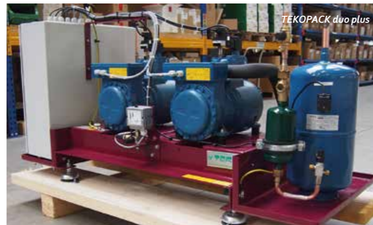
TEKOPACK duo plus

Die zukunftssichere Serie erhalten Sie inklusive montiertem und verdrahtetem Schaltschrank – ausgestattet mit dem ideal passenden Regelsystem FRIGOENTRY. TEKOPACK duo plus ist BAFA-konform durch die optimale Leistungsregulierung, welche eine hohe Regelgüte und Effizienz mit sich bringt. Ein stabiler Saugdruck und reduzierte Schaltzyklen sorgen für hohe Zuverlässigkeit. Die Maschine ist variabel in der Aufstellung und bietet eine schnelle Installation.